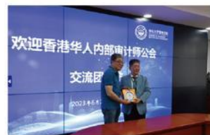
管理學院贈送紀念品。